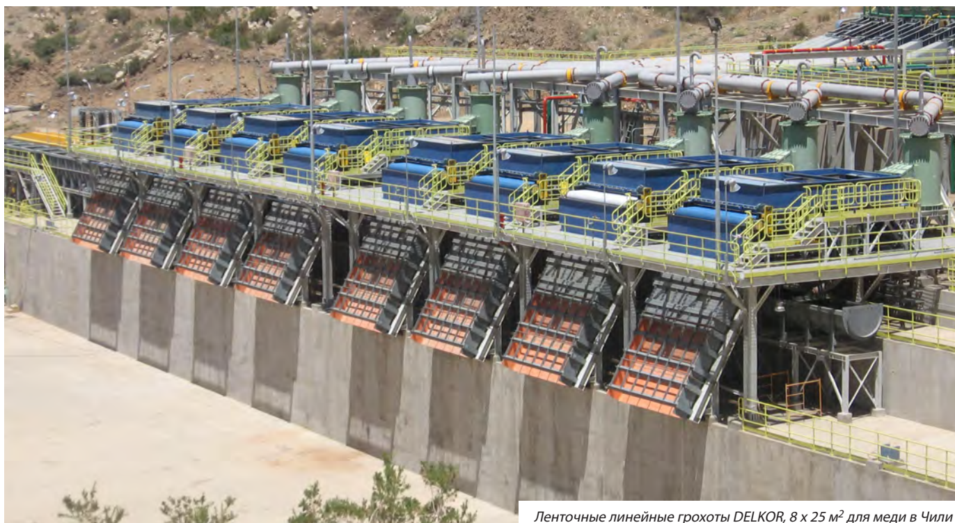
Ленточные линейные грохоты DELKOR, 8 x 25 м 2 для меди в Чили

Safety | Reliability | Innovation | Sustainability