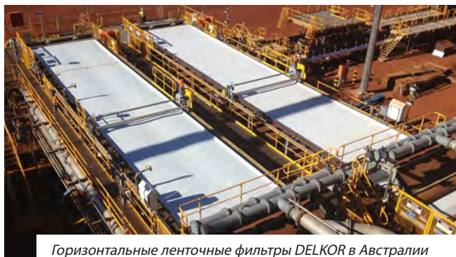
Горизонтальные ленточные фильтры DELKOR в Австралии