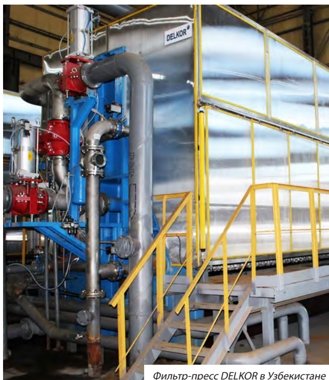
Фильтр-пресс DELKOR в Узбекистане

Фильтр-прессы DELKOR отличаются прочной конструкцией, и каждый аппарат адаптирован к конкретным технологическим требованиям, и, таким образом, специально разработан для суровых условий горнодобывающей промышленности.