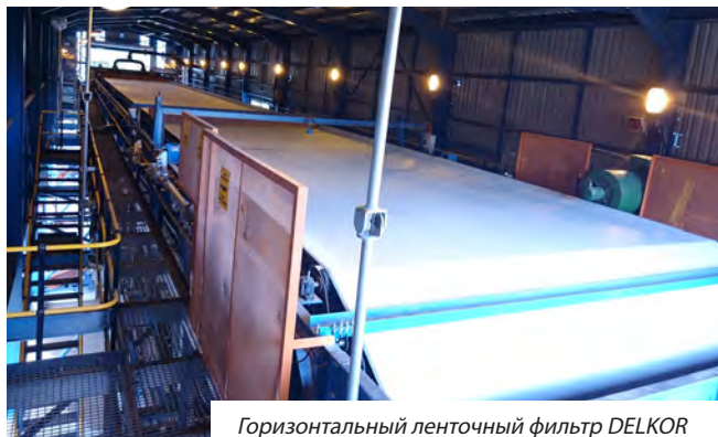
Горизонтальный ленточный фильтр DELKOR

Обезвоженные хвосты можно использовать для обратной засыпки шахт или прямой отправки на хранилище сухих хвостов (DST). В результате мы имеем технически жизнеспособное и экономически целесообразное решение по переработке хвостов самым безопасным и экологическим способом. Фильтры DELKOR могут использоваться как автономные машины или в сочетании с другими фильтрационными установками.