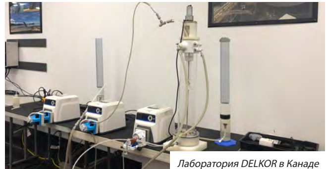
Лаборатория DELKOR в Канаде

Специализированная группа послепродажного обслуживания DELKOR следит за работой установленного оборудования и проводит регулярные проверки работоспособности на объекте. При необходимости они предоставляют подходящие предложения по замене деталей в целях модернизации и/или исправления, что приведет к повышению производительности оборудования. Сервисная команда работает круглосуточно и без выходных, обеспечивая своевременное и надежное обслуживание установленного оборудования, обеспечивая более быстрое исправление / обслуживание и гарантируя, что ваша система вернется в работу как можно быстрее!