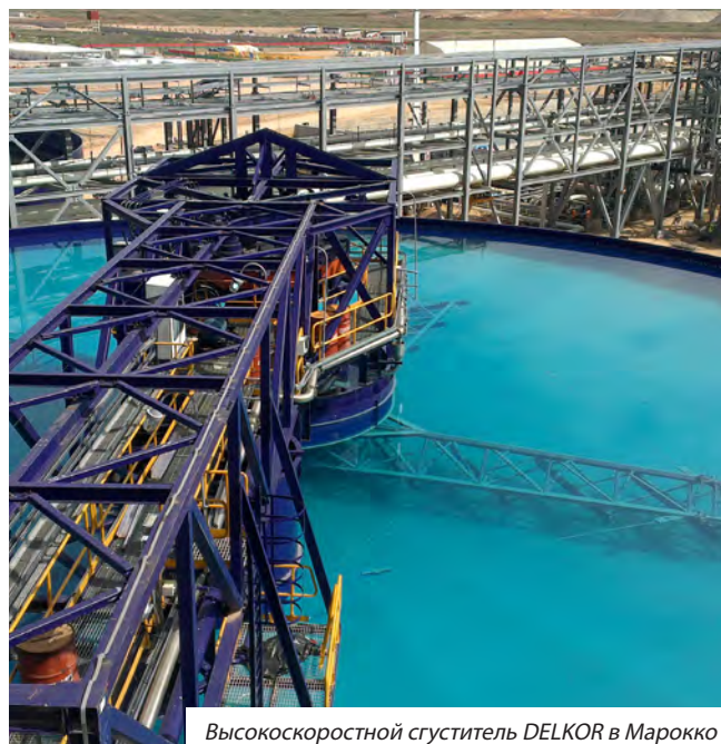
Высокоскоростной сгуститель DELKOR в Марокко