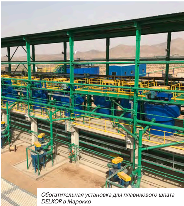
Обогатительная установка для плавикового шпата DELKOR в Марокко