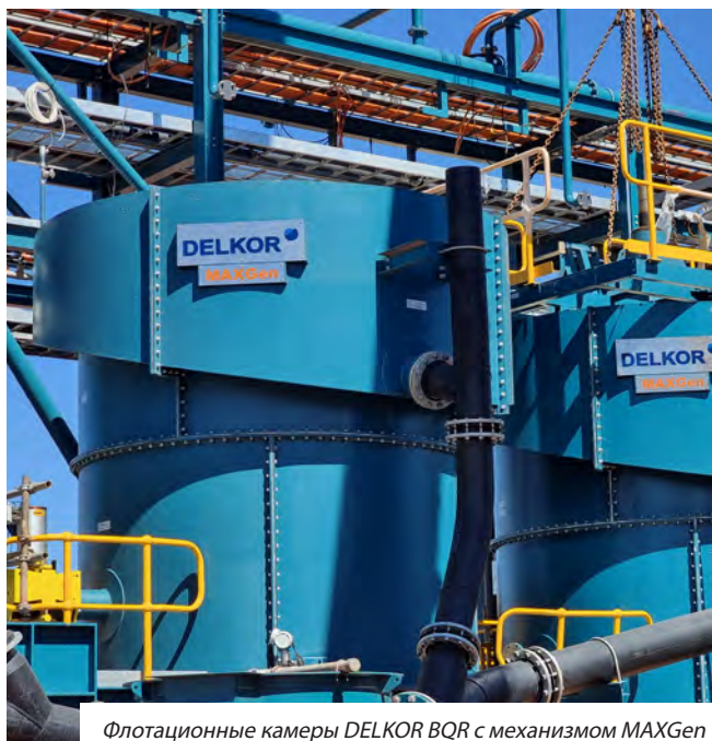
Флотационные камеры DELKOR BQR с механизмом MAXGen

Механизм MAXGen фокусируется на создании воздушных пузырьков с оптимальным распределением по размеру, что способствует одинаковой флотации мелких и крупных частиц, при этом эффективно удерживаются твердые частицы во взвешенном состоянии. Это дает максимальную вероятность взаимодействия пузырьков с частицами и приводит к большему извлечению ценных материалов и энергоэффективной гидродинамике.