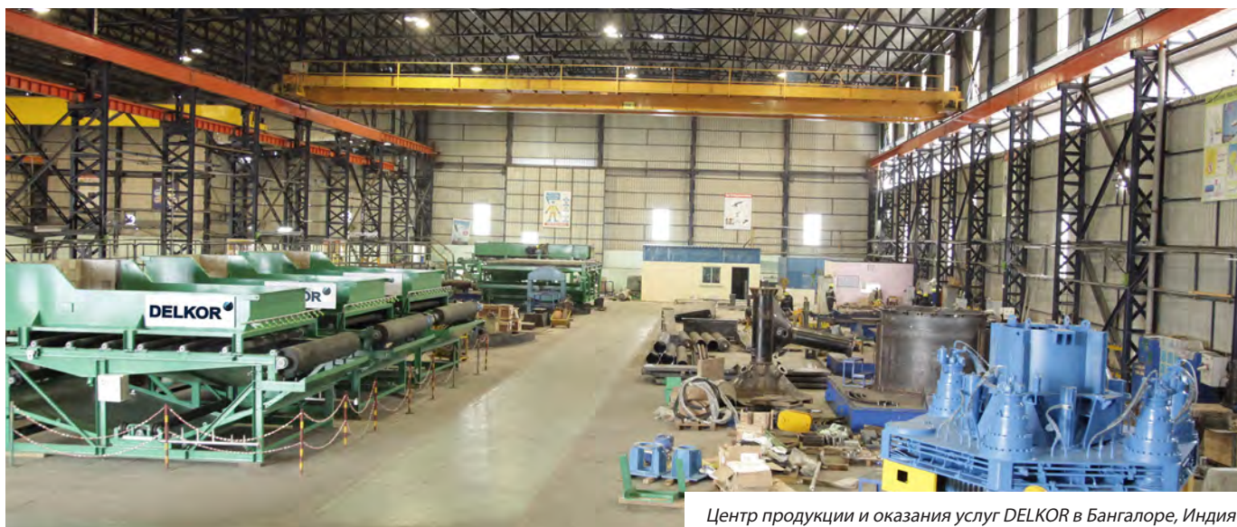
Центр продукции и оказания услуг DELKOR в Бангалоре, Индия